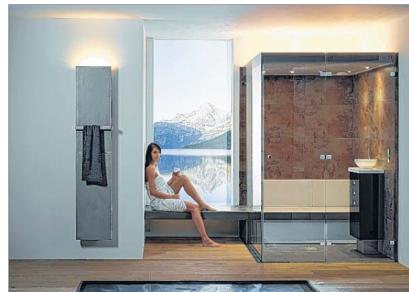
Verwirklichen Sie Ihre Träume - Mit Ihrer eigenen Wellnessoase zu Hause.

stützt das Schwitzen und die Entschlackung und hat eine äußerst positive Wirkung auf die Atemwege. Poren öffnen sich noch besser, wodurch die Haut optimal gereinigt werden kann. Ein guter Tipp: Zwischen und nach dem Dampfbaden schwitzt der Körper, also warm einpacken und Ruhepausen einlegen!