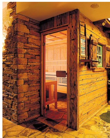
Schwitzen in der Sauna öffnet die Poren.