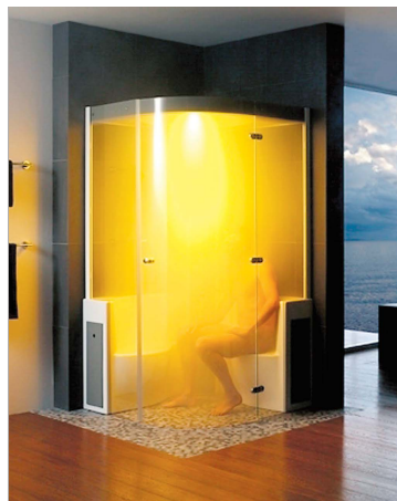
In der Dampfdusche lässt es sich gut entspannen.